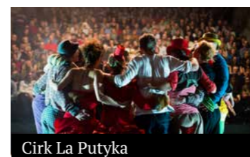
Cirk La Putyka