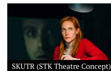
SKUTR (STK Theatre Concept)