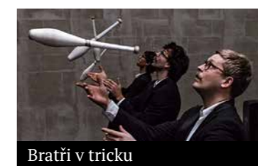
Bratři v tricku