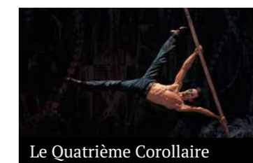
Le Quatrième Corollaire