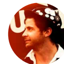
Dramaturgie Vít Novák