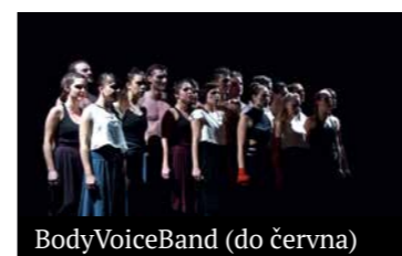
BodyVoiceBand (do června)